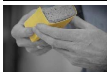
File og slibe