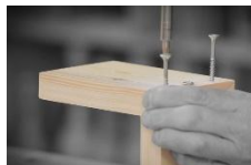
Samlinger i træ