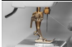
Kende til symaskine